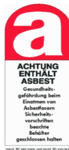
Warnhinweis nach UVV